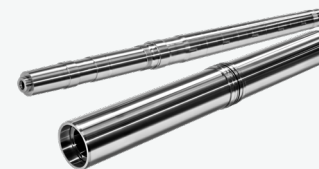
Bohr- und Frässpindeln